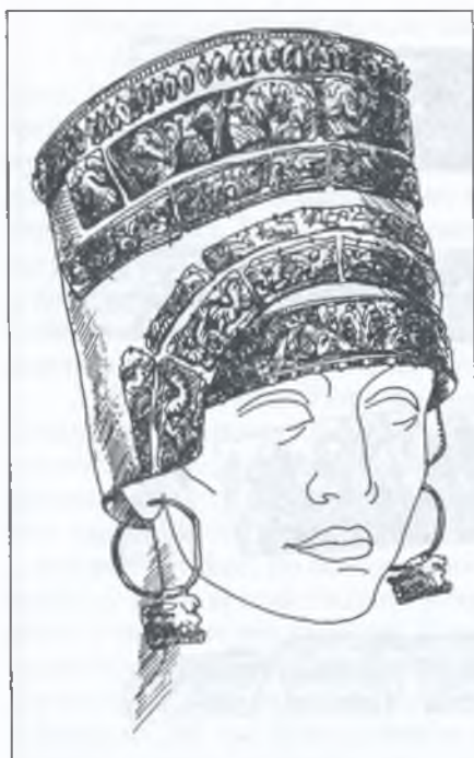
Рис. 2. Реконструкція тиари (художник Ю. Є. Тітінюк)

наявність у цьому місці відбитка аналогічного змісту і тлумачити весь сюжет як сцену закінчення полювання, де скіф схилився над поваленим стрілою чи списом (дротиком) оленем.