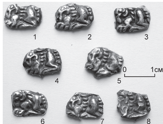
Рис. 3. Бляшки с изображением грифона из кургана № 25 Песочинского могильника (Харьковский исторический музей, ЛБЗ-404-408; 423-425)

Особенностям семантики хвоста хищников как условного знака-символа в зависимости от его расположения посвящено специальное исследование Ю. Б. Полидовича. Из выделенных автором иконографических вариантов наш