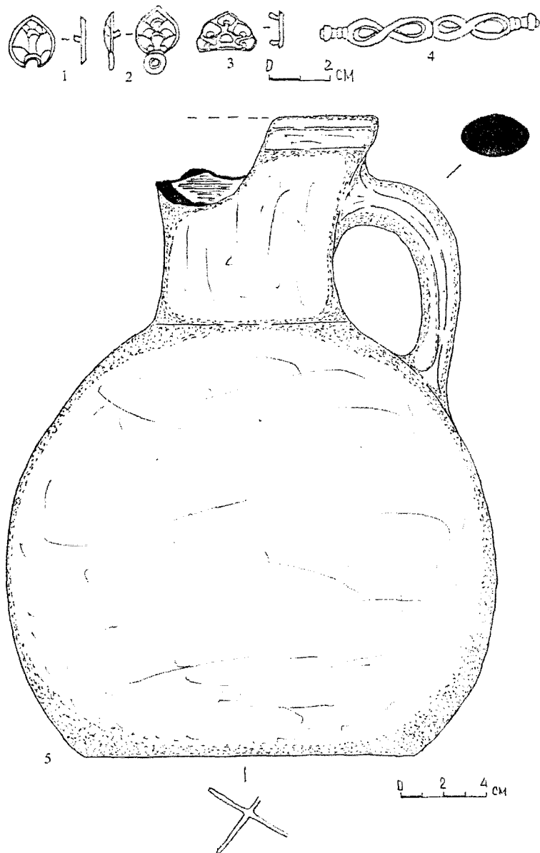
Рис. 3. Инвентарь погребения № 482. 1 – 3 – поясные бляшки; 4 – поясной разделитель; 5 – кувшин из заполнения могильной ямы.